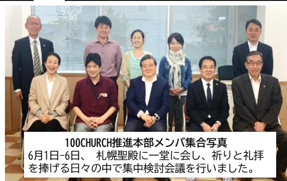
100CHURCH推進本部メンバ集合写真 6月1日-6日、札幌聖殿に一堂に会し、祈りと礼拝を捧げる日々の中で集中検討会議を行いました。

主の大いなるご加護と導きにより、開校時には多くの優秀な神学生をお迎えできますよう、引き続きお祈りをお願い申し上げます。