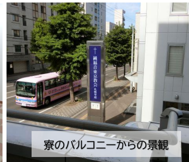
寮のバルコニーからの景観